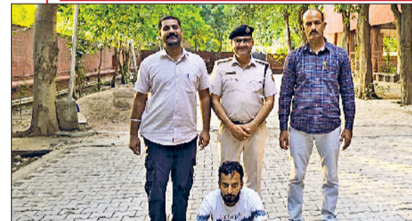
रेवाड़ी। नशीली दवाओं के साथ काबू किया गया आरोपी।

किसी के आने का इंतजार कर रहा है। सूचना मिलने के बाद पुलिस ने मौके पर जाकर बताया गए हलिया अनुसार एक युवक से पूछताछ की