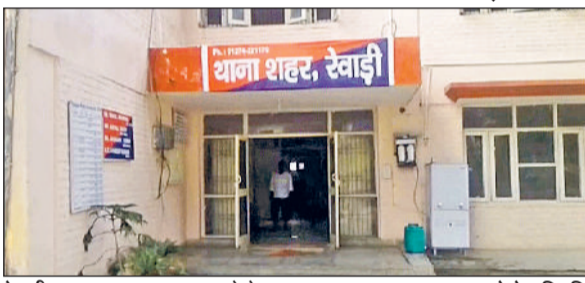
रेवाड़ी। थाना शहर का फाइल फोटो।