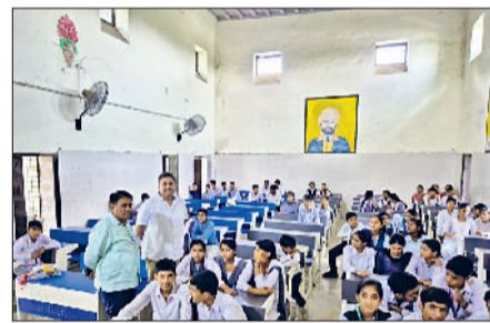
रेवाड़ी। निबंध लेखन प्रतियोगिता में भाग लेते विद्यार्थी।