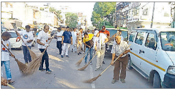
रेवाड़ी। गढ़ी बोलनी रोड पर सफाई करते हुए नागरिक तथा गढ़ी बोलनी रोड पर कवरा उठाते हुए विधायक।