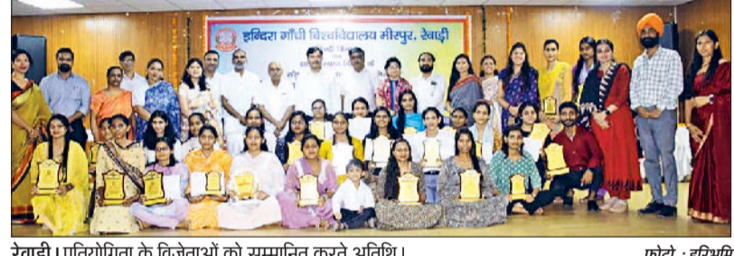
रेवाड़ी। प्रतियोगिता के विजेताओं को सम्मानित करते अतिथि।