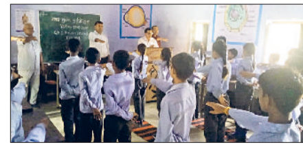
कहा कि नशा एक ऐसी बुराई है, जिससे व्यक्ति का अनमोल जीवन समय से पहले ही मौत का शिकार हो जाता है।

जिला पुलिस ने युवाओं व आमजन को नशे के दुष्प्रभावों के बारे में जागरूक करने के लिए और खेलों से जोड़ने के लिए अभियान चलाया हुआ है, जिसका मुख्य उद्देश्य युवाओं व आमजन को नशे की बुराईयों से अलग कराना तथा नशे के आदी युवाओं को समाज की मुख्यधारा में जोड़ना है। पुलिस की नशा मुक्त टीम ने शनिवार को गवर्नमेंट स्कूल फिदेडी में विद्यार्थियों व आमजन को नशे से दूर रहने तथा शिक्षा व खेलों से जुड़ने के लिए प्रेरित किया तथा नशा न करने की शपथ भी दिलाई। पुलिस टीम ने शनिवार तीन नशा पीड़ित व्यक्तियों की पहचान करके काउंसिलिंग कराकर रेवाड़ी डी एडिक्शन सेंटर में भर्ती कराया। अभियान के दौरान नशा मुक्ति टीम ने अब तक 44 नशा पीड़ितों का इलाज कराया है। एस्पपी हेमैंद्र कुमार मीणा ने