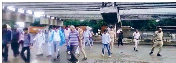
रेवाड़ी। चौक पर ट्रैफिक कंट्रोल करने के लिए मौजूद पुलिसकर्मी।

सर्विस लेन बार-बार क्षतिग्रस्त हो जाती है, जिस कारण यहां लंबा जाम लगना आम बात हो गई है। खासकर बारिश के बाद इस चौक पर लंबा जाम वाहन चालकों के लिए भारी परेशानी का सबब बन जाता है। वाहनों में बैठे बुजुर्गों, बच्चों और महिलाओं को लंबे जाम में फंसने के बाद भारी असुविधा का सामना करना पड़ता है। कई बार तो उन्हें गर्मी के मौसम में पानी तक नसीब नहीं होता।