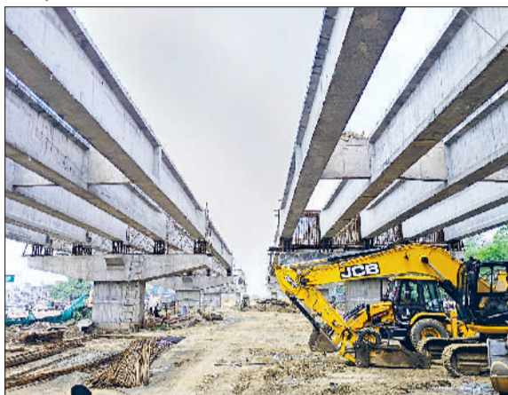
रेवाड़ी। बनीपुर चौक पर निर्माणाधीन फ्लाईओवर, गत दिनों टूटी सड़क के कारण पलटने के बाद जले टैंकर का फाइल फोटो।

दिल्ली-जयपुर नेशनल हाइवे पर बनीपुर चौक पर निर्माणाधीन फ्लाईओवर तीन साल से अटका पड़ा है। प्रमुख नेशनल हाइवे पर फ्लाईओवर का निर्माण समय पर पूरा नहीं होने के कारण यह चौक बदनूमा दाग साबित हो रहा है। इसका तुरंत निर्माण कराने की मांग को लेकर महापंचायत तक हो चुकी है। अब केंद्रीय मंत्री राव इंद्रजीत सिंह ने फ्लाईओवर के मामले को गंभीरता से लिया है। उन्होंने 22 सितंबर को होने वाली जिला विकास समन्वय एवं निगरानी समिति की बैठक में एनएचआई के अधिकारियों को भी बुलाने के निर्देश दिए हैं। इस बैठक में केंद्रीय मंत्री एनएचआई के अधिकारियों से जवाब मांगेंगे। देश के प्रमुख राजमार्ग पर बावल व रेवाड़ी को जोड़ने वाली सड़क की क्रासिंग होती है। इस चौक पर अक्सर हादसे होते रहे हैं, जिस कारण पूर्व मंत्री डा. बनवारीलाल के प्रयासों से तीन साल पहले फ्लाईओवर का निर्माण कार्य शुरू हुआ था। इस फ्लाईओवर को दो साल में तैयार करने की डेडलाइन थी, परंतु